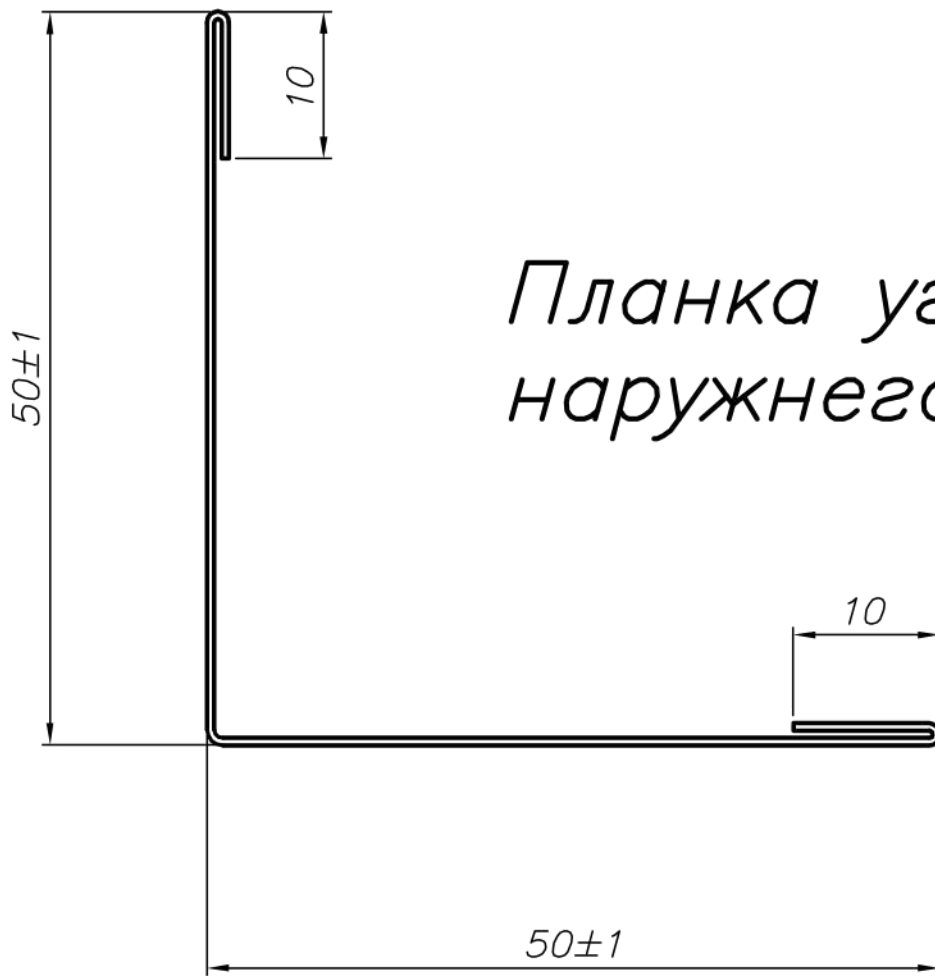
Планка угла наружного 50 x 50