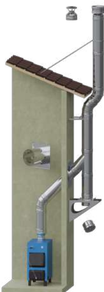
Для котла по наружной стене