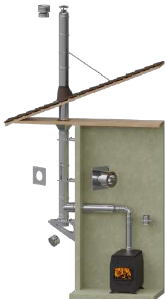
Для котла/печи вдоль наружной стены