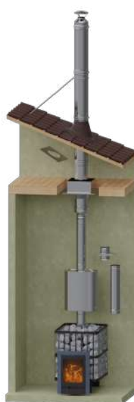
Для печи внутри помещения